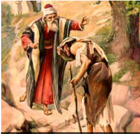
L'une des leçons clés que nous enseigne La parabole de l'enfant prodigue est que l'espoir d'une réconciliation ne meurt jamais.

Pour en revenir à la parabole de Christ, elle atteint maintenant son point culminant. Le jeune homme reprend ses esprits lorsqu'il se rend compte que les serviteurs de son père ont amplement de nourriture à leur disposition et n'ont jamais faim. Il se dit : « Je me lèverai, j'irai vers mon père, et je lui dirai: Mon père, j'ai péché contre le ciel et contre toi... » (Luc 15:18) Imaginez ce moment d'humilité. L'enfant prodigue est au bout du rouleau et a perdu toute confiance en lui-même. Il se rend compte qu'il ne peut plus aller de l'avant seul. Il sait qu'il doit rentrer chez lui. Son cheminement a atteint un point crucial.