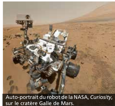
Auto-portrait du robot de la NASA, Curiosity , sur le cratère Galle de Mars.

L'on pourrait très bien se demander si ces diverses similitudes indiquent que la vie est possible sur Mars.