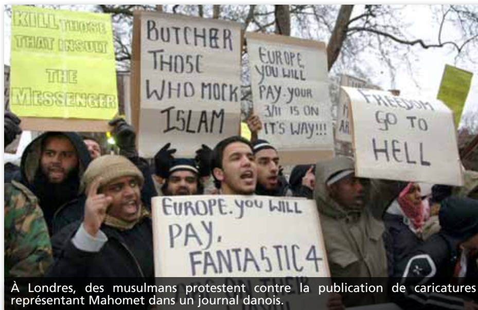
À Londres, des musulmans protestent contre la publication de caricatures représentant Mahomet dans un journal danois.

Ce n'est qu'après la prolifération de confessions protestantes que la tolérance religieuse est devenue la norme, tout au moins dans les pays protestants du nord-ouest de l'Europe. « S'il n'y avait qu'une seule religion en Angleterre, a écrit Voltaire dans ses Lettres philosophiques , le despotisme serait à craindre, s'il y en avait deux, leurs adeptes se trancheraient la gorge les uns les autres, mais comme il y en a trente, tout le monde vit en paix et heureux. » (Cité