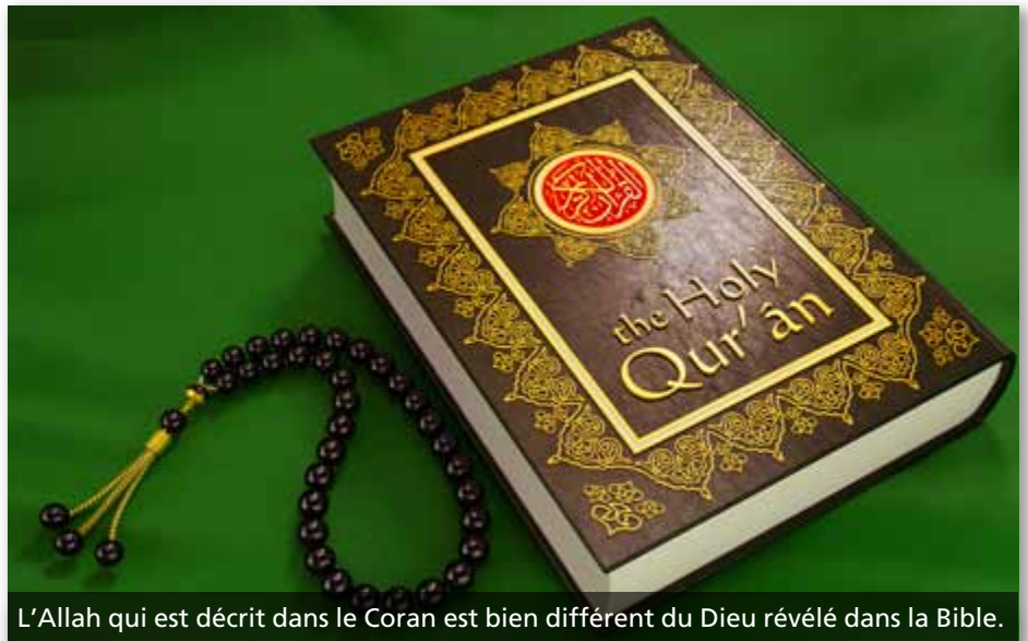
L'Allah qui est décrit dans le Coran est bien différent du Dieu révélé dans la Bible.

disent croire en un seul Dieu, le Dieu de la Bible et l'Allah du Coran ne sont pas une seule et même entité. « L'islam a pour point de départ et d'arrivée le concept selon lequel il n'existe pas d'autre dieu qu'Allah. Allah est tout-puissant, souverain et inconnaissable . » (David Burnett, Clash of Worlds , 2002, p. 114 ; c'est nous qui mettons l'accent sur certains passages.)