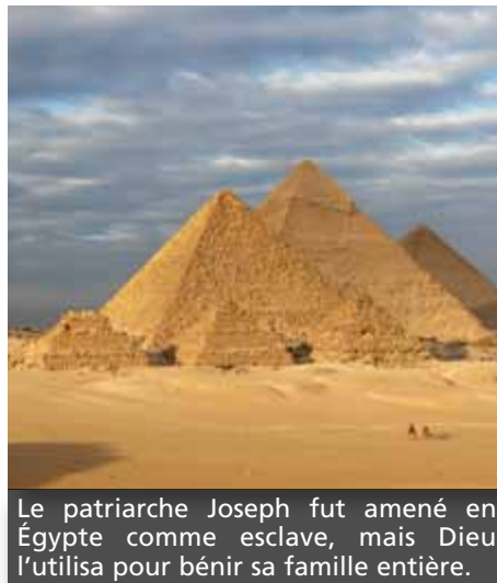
Le patriarche Joseph fut amené en Égypte comme esclave, mais Dieu l'utilisa pour bénir sa famille entière.

Réalisant la nature catastrophique de leur antagonisme, le frère aîné, Ruben réussit à calmer les autres pendant un court laps de temps (versets 21-24). Mais plus tard, à son