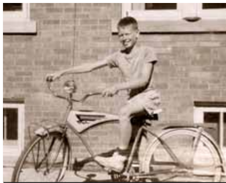
L'auteur, en 1960, montre sa récompense pour six semaines de dur labeur.

La plupart de l'humanité a suivi cette tendance similaire. L'histoire montre qu'en refusant de suivre les voies et les lois de Dieu, la plupart de l'humanité se heurte à la douleur et à la détresse. En conséquence, beaucoup de gens trouvent leur travail ingrat et peu satisfaisant. Un sondage réalisé par l'institut Gallup révéla que seulement environ la moitié des travailleurs américains sont satisfaits de leur emploi.