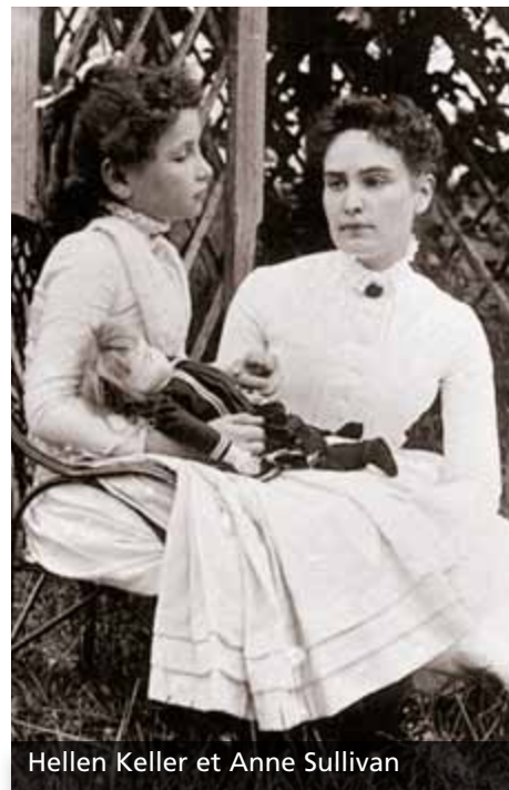
Hellen Keller et Anne Sullivan

À l'école Perkins, sa situation commença à s'améliorer. Anne reçut un traitement supplémentaire qui améliora sa vue suffisamment pour lui permettre de lire pendant de courtes périodes. En conséquence, elle se concentra avec diligence sur ses études